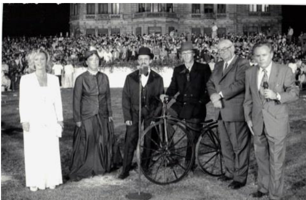
Les manifestations ayant eu pour cadre le parc de Marbeaumont : concours hippique 1950, journée de la bicyclette 1953, fête Courteline 1954, festival du twist 1963, féerie de la glace 1964, fête du bicentenaire du rattachement de la Lorraine et du Barrois à la France 1966, Intervilles 1991