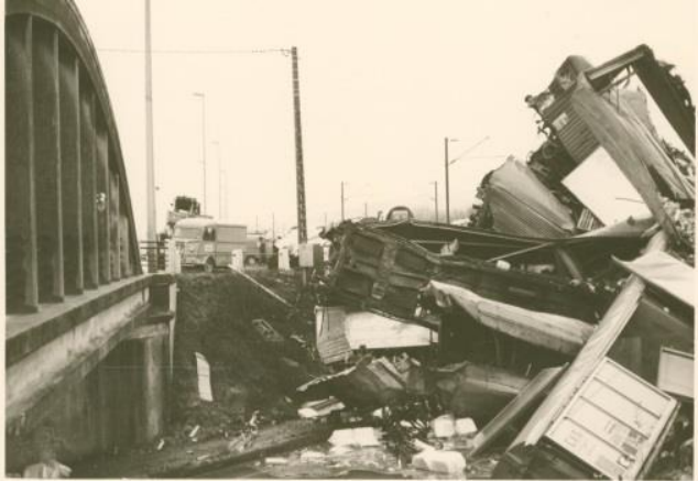
Le déraillement d'un train de marchandises sur la ligne Paris-Strasbourg au pont Dammarie en 1976