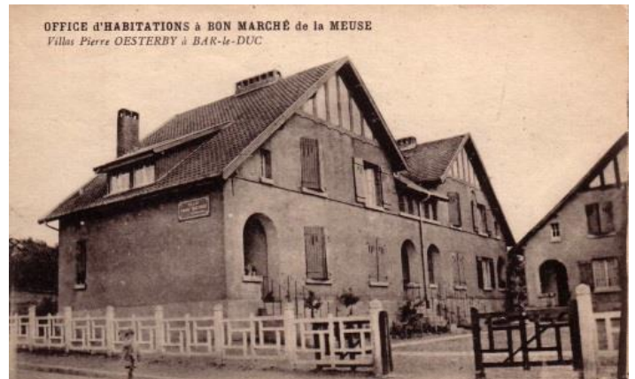
La construction des villas Pierre Oesterby en 1929 et les colonies de vacances des Barisiens au Danemark dès 1926