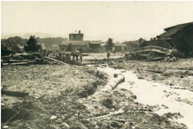
Les inondations à Marbot 1889-1900-1930-1972