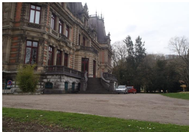
Le château de Marbeumont dont les dépendances furent incendiées en 1944.