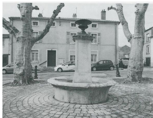
La place de l'Etoile appelée aussi « place de la fontaine », dont l'eau jaillit à nouveau même si elle n'est plus alimentée par des sources, a été restaurée et recouverte de pavés.