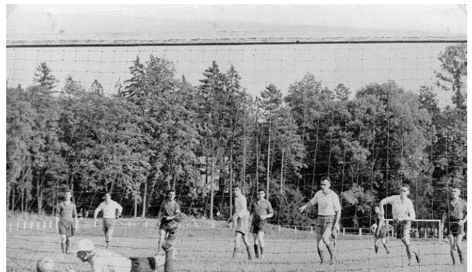
Le stade de Marbeaumont - le football et l'équipe du B.A.C.C. en 1961