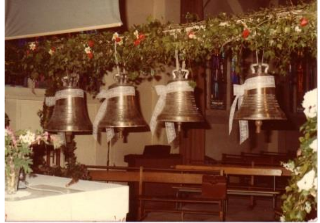
La bénédiction des quatre cloches de l'église Saint-Charles en 1983